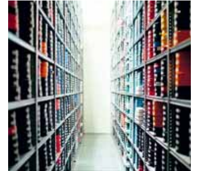
Geymsla Kvikmyndasafn Íslands varðveittir fjölda íslenskra kvikmynda.